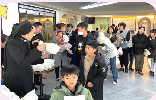
(어린이 미사 봉헌 후 선물 나눔)